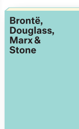
Band 4 Erscheint am 15. Juni 2018