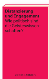
Band 2 Erschienen am 15. Januar 2018