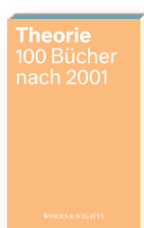
Band 1 Erschienen am 15. Juli 2017

© Works & Nights Gestaltung: Lena Haubner, Weimar